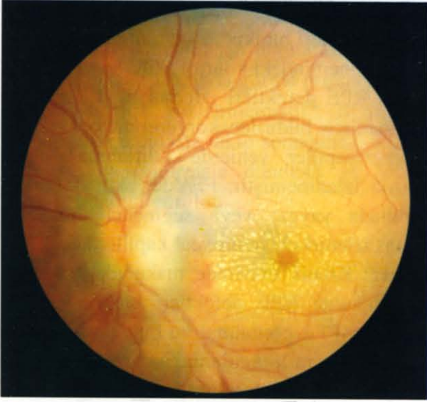
Resim 1. Hastanın sol fundus fotoğrafı.